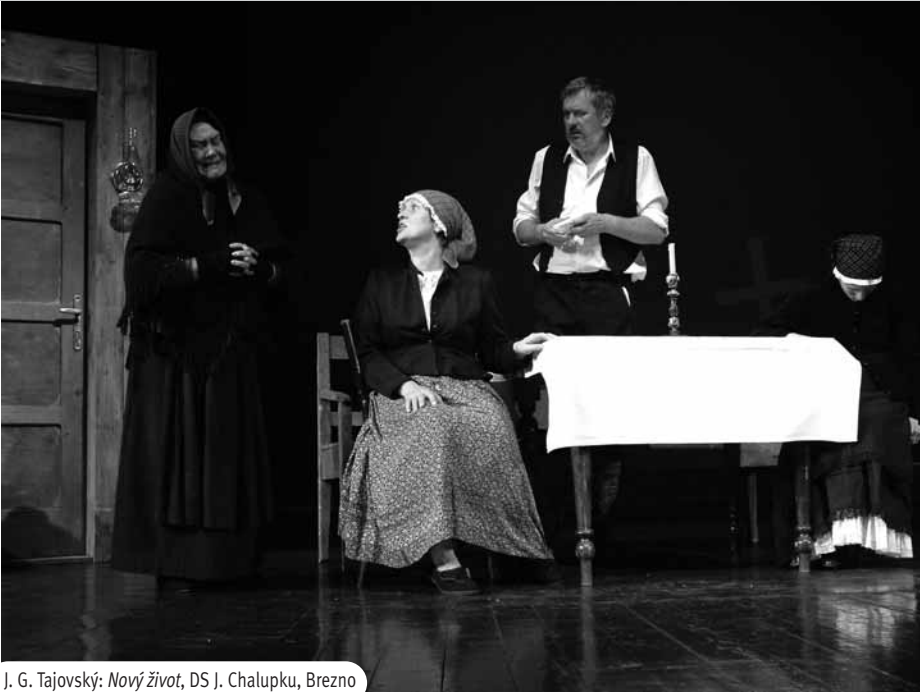
J. G. Tajovský: Nový život , DS J. Chalupku, Brezno