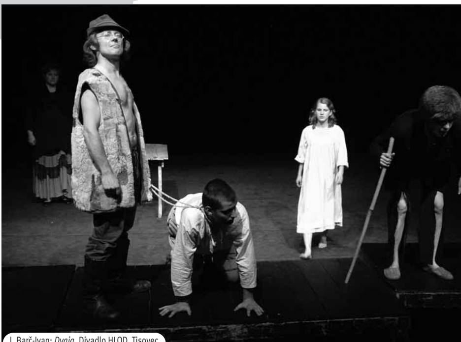
J. Barč-Ivan: Dva , Divadlo HLOD, Tisovec

S cénická žatva v Martine je o niečo starším festivalom ako Jiráskov Hronov. Darmo občas bratia Česi čarujú s číslami. Naozaj je staršia. Veď aj dosť dlho pôsobila unavenejším dojmom. Presun jesenného termínu na letný jej však očividne prospieva. Časy, keď mohli slovenskí ochotníci medzi sebou súťažiť až vtedy, keď bolo zbožie pod strechou, všetky role dôkladne poorané a ovce odvelené z hôľ, sú už dávno preč. Zdá sa, že koniec augusta je dobre premyslený termín. Ešte sú prázdniny na všetkých stupňoch škôl, sezóna v profesionálnych divadlách sa ešte poriadne nezačala, snaha ešte si niečo užiť z leta vrcholí. Martin nie je taký vreckový ako Hronov. Tí, čo sú ubytovaní v strojárskych internátoch, o tom vedia svoje. Hlavne ich nohy. Aj zo Slovenského komorného divadla je do Strojára ďalej ako z Jiráskovho divadla do sály Josefa Čapka. Problémy s chodidlami však vie Martin vynahradiť géniom loci jedného z najpodstatnejších historických centier kultúrneho života Slovákov. Na miestnom cintoríne, v pôde kraja, ktorý nám dal jadro spisovného jazyka, odpočívajú naše naozajstné celebrity. Kto chce, môže si popri príjemnej prechádzke urobiť stručnú exkurziu do našich národných dejín alebo po hodnotení kropiť slzami dojatia či ukrivdenia hroby veľikánov.