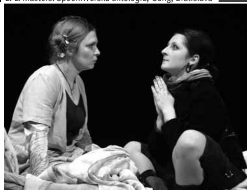
N. Koľada: Murlin Munro , DS G. F. Belopotockého, L. Mikuláš

netnejšie ako hodnotenia poroty. Divákovi — seminaristom sa navyše môže podariť pomenovať aspekty inscenácie, ktoré porota nevníma (inak povedané — viac hláv viac vie). Možno som príliš naivný, ale verím tomu, že v spoločnostiach, kde divadlo dokáže dobre zachytiť a pomenovať problémy doby, funguje dobre aj širší spoločenský dialóg (pre príklad by som opäť zašiel do nemeckej jazykovej oblasti).