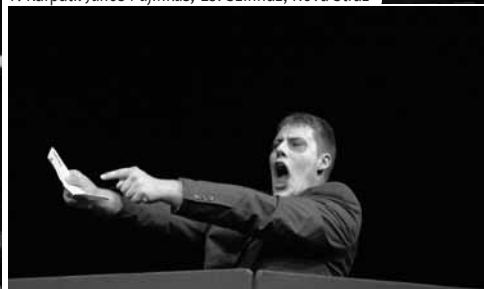
E. L. Masters: Spoonriverská antológia , Gong, Bratislava