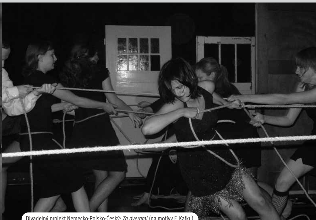
Divadelný projekt Nemecko-Poľsko-Český: Za dverami (na motívy F. Kafku)