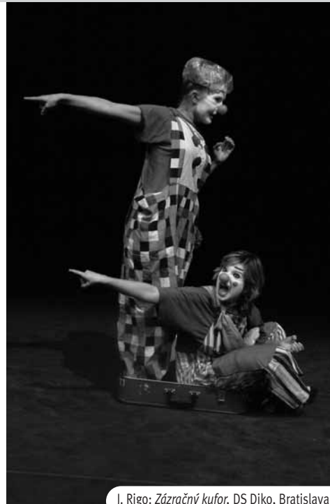
J. Rigo: Zázračný kufor , DS Diko, Bratislava

podiel Andersena „na fabulačnom poľudštení hry“. Inscenácia začína ako moralieta o poslaní zázračnej zápalky, neskôr sa mení na radenie etúd, ktoré systémom princípov dramatickej výchovy prezentuje schopnosti, ale aj herecké limity Lendačanov. Metodológia tvorby sujetu zostala zahmlená, hoci inscenačný tvar tak nepôsobil. Radosť z hry detských hercov bola evidentná. Hoci inscenačný tvar tak nepôsobil. Mnohé zvolené postupy boli zaujímavé riešené, miestami však sklzli do samoúčelného predvádzania výsledkov improvizácie ako výsledku skúšobného procesu. Pri prenose inscenácie do nového priestoru by mohla režisérka zúžiť priestor tak, aby sa herci neutápali v šírke javiska. Súbor naplnil ambíciu, ktorú si súbor stanovil na začiatku svojej práce v zmysle: „Zlepili sme dielko, ktoré ľudí oslovilo a nám robí nesmierne potešenie prezentovať sa.“